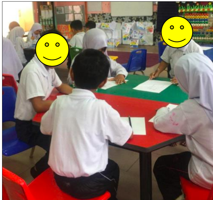
Rajah 5. Aktiviti melakar secara berkelompok.

Menurut Gibson (1979), aktiviti artistik yang berlangsung perlu dimanfaatkan bagi menentukan perhatian oleh seseorang individu yang berpotensi dengan tingkah laku dan tindakan. Di samping itu, Williams (2019) mendapati pendekatan melalui sesebuah program artistik membuka peluang perkembangan individu mengenai kefahaman unsur seni dan reka bentuk yang berfokus. Beliau berpandangan melalui program yang difokuskan membuka pendedahan kanak-kanak dan guru ke dalam program kreatif. Program artistik adalah sebahagian konsep untuk mengukuhkan pembelajaran kanak-kanak di dalam kelas. Rajah 5 menunjukkan suasana aktiviti melakar secara berkelompok yang dijalankan oleh kanak-kanak di dalam kelas.