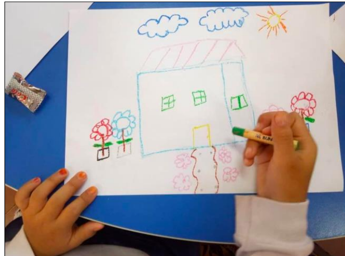
Rajah 3. Lakaran imej rumah impian.

Di samping itu, proses kesahan kandungan harus terlibat dengan penggunaan pakar dalam seni visual, sains, pendidikan, penilaian dan kreativiti seperti yang disebut oleh Wilson dan Presley (2019). Perancangan aktiviti melakar digabungkan dengan aspek motivasi memberikan impak hubungan perkongsian penghasilan karya seni visual. Pemahaman pendidikan seni visual memerlukan guru memantau kanak-kanak prasekolah untuk menyesuaikan keperibadian mereka dengan perkembangan dan kemahiran membuat lakaran. Lakaran asas harus digabungkan dengan keperluan dan faktor komposisi imej melalui kemahiran guru. Menurut Nagamachi (2002), melalui pendekatan pendidikan seni visual bertujuan untuk mengungkap dan menjangka perasaan artistik melalui gambar dan objek. Tambahan pula, karya lakaran yang dihasilkan oleh kanak-kanak prasekolah perlu dijalankan di dalam kelas secara individu dan berada dalam kondisi berkelompok. Rajah 4 menunjukkan hasil lakaran untuk tugas imej ahli keluarga yang dijalankan oleh kanak-kanak.