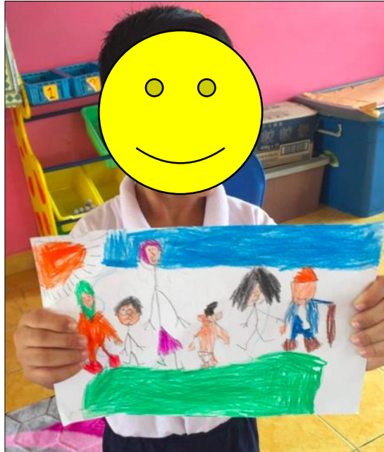
Rajah 6. Nilai tambah kepada imej lakaran.

Pembentukan dan penjejakan tema tugas kepada pengkaryaan kanak-kanak prasekolah adalah melalui; (i) dimensi dan deria rasa semasa belajar melakar; (ii) fungsi gambaran imej dan keperluan pemahaman estetika seni visual; dan (iii) interaksi keperibadian kanak-kanak prasekolah dalam kesenian.