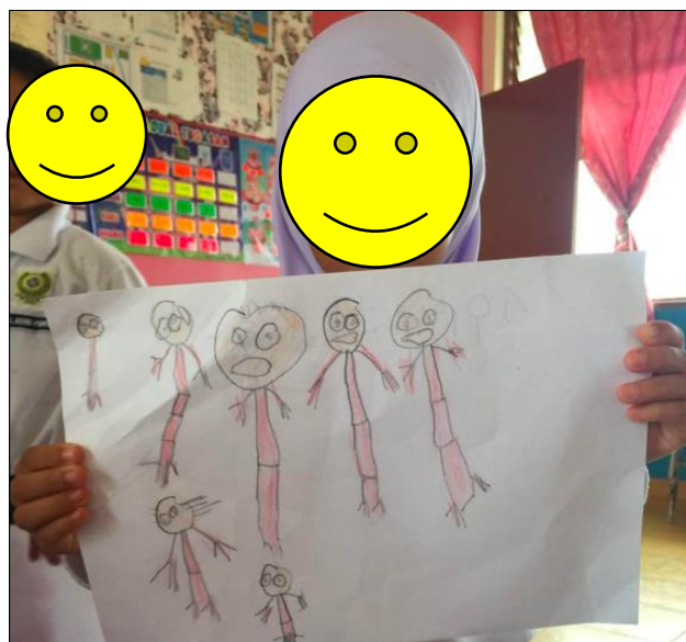
Rajah 4. Lakaran imej ahli keluarga.

Di samping itu, proses kesahan kandungan harus terlibat dengan penggunaan pakar dalam seni visual, sains, pendidikan, penilaian dan kreativiti seperti yang disebut oleh Wilson dan Presley (2019). Perancangan aktiviti melakar digabungkan dengan aspek motivasi memberikan impak hubungan perkongsian penghasilan karya seni visual. Pemahaman pendidikan seni visual memerlukan guru memantau kanak-kanak prasekolah untuk menyesuaikan keperibadian mereka dengan perkembangan dan kemahiran membuat lakaran. Lakaran asas harus digabungkan dengan keperluan dan faktor komposisi imej melalui kemahiran guru. Menurut Nagamachi (2002), melalui pendekatan pendidikan seni visual bertujuan untuk mengungkap dan menjangka perasaan artistik melalui gambar dan objek. Tambahan pula, karya lakaran yang dihasilkan oleh kanak-kanak prasekolah perlu dijalankan di dalam kelas secara individu dan berada dalam kondisi berkelompok. Rajah 4 menunjukkan hasil lakaran untuk tugas imej ahli keluarga yang dijalankan oleh kanak-kanak.