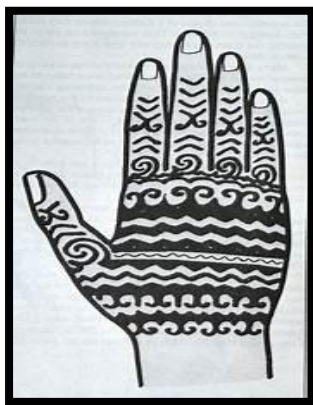
Reka corak tatu Entegulun

Seni tatu merupakan salah satu gambaran keindahan jiwa, nilai estetika dan budaya yang dimiliki oleh masyarakat Iban. Keindahan pada seni tatu dapat dilihat pada aspek pembuatan, penggunaan bahan-bahan dari sumber alam, kehalusan, ketelitian, kesabaran tukang pencacah tatu, sumber idea dari alam semula jadi dan daya kekekrativiti pada hasil kesenian tersebut.