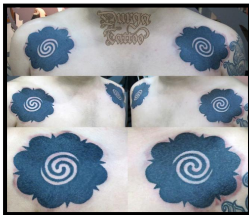
Rajah 4: Motif tatu bungai terung yang dicacah pada bahu individu lelaki masyarakat Iban

dikategorikan sebagai warisan tidak ketara. Kearifan tradisi yang berkaitan dengan seni tatu dalam budaya masyarakat Iban diperlihatkan melalui motif, ragam hias, nilai estetika dan seni (Rujuk Rajah 4).