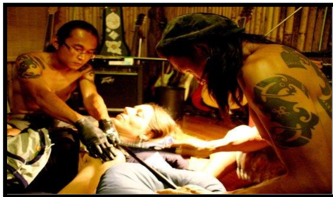
Rajah 6: Proses pembuatan tatu menggunakan kaedah tradisional

istilah alung . Dalam penghasilan tatu alung ini akan dicampur dengan pelbagai jenis ubat pemanis supaya cacahan tersebut kelihatan lebih cantik dan juga sebagai perlindungan. Pembuatan tatu secara tradisional ini menggunakan teknik mengetuk yang menggunakan pengetuk yang diperbuat daripada tanduk rusa serta sebatang kayu untuk meletakkan jarum yang diperbuat digunakan untuk mencacah tatu (Rujuk Rajah 6). Pembuatan tatu dengan menggunakan kaedah tradisional adalah lebih sukar kerana kekuatan tangan, kesabaran dan ketelitian amat diperlukan dalam menghasilkan tatu yang lebih berkualiti (Sabang, 2014).