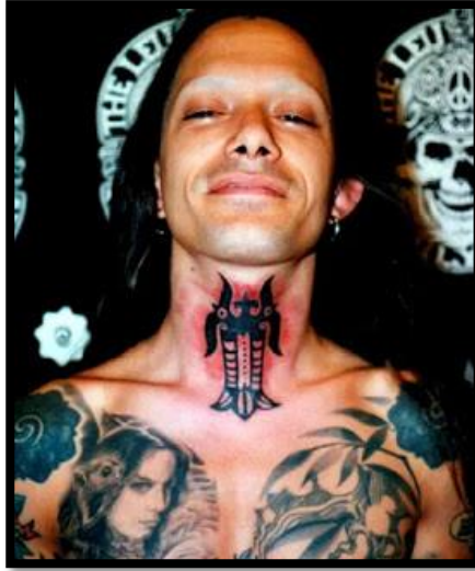
Rajah 5: Motif tatu ukir rekung

golongan pahlawan yang sudah melakukan kegiatan memburu dan panglima. Perkembangan status pada seseorang individu tersebut dapat dilihat berdasarkan tatu yang dicacah pada bahagian leher. Ini kerana bahagian leher merupakan bahagian tubuh yang paling sukar untuk dicacah dengan tatu dan ini dipercayai dapat menguatkan semangat individu tersebut.