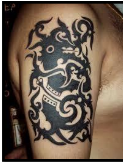
Rajah 3: Reka corak tatu Kelingai yang dicacah pada bahu individu lelaki Iban

Manusia mencipta estetika kerana mereka belajar dari alam. Justeru itu, alam dijadikan sebagai ‘guru’. Ini kerana pemikiran manusia terbina dari alam. Bermakna alam itu berkembang mengajar manusia untuk berfikir. Kehidupan manusia sering dikaitkan dengan alam semesta tempat manusia belajar dan memberi pelajaran kepada manusia yang lain. Kehidupan manusia yang bersandar kepada alam semesta mewujudkan asimilasi yang sering memerlukan dalam kehidupan. Manusia memerlukan elemen-elemen alam seperti gunung, sungai, tumbuhan, tanah dan air untuk memastikan kelangsungan kehidupan yang lebih baik. Manakala, alam semesta memerlukan manusia sebagai penjaganya. Masyarakat Iban belajar dan berasimilasi dengan alam semula jadi dan mewujudkan nilai estetika dalam kehidupan mereka (Rujuk Rajah 3).